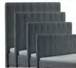
0046S - Höhe 99 cm 0046M - Höhe 109 cm 0046L - Höhe 119 cm 0046XL - Höhe 129 cm gegen Aufpreis