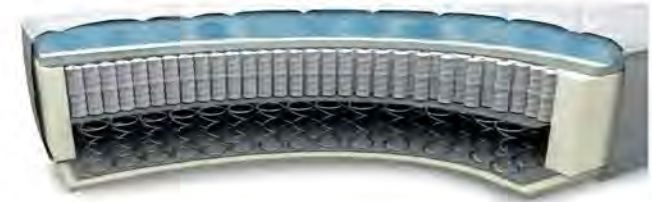
MA760GA gegen Aufpreis