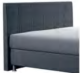
0320 Höhe 115 cm gegen Aufpreis