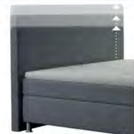
0300 Multimaß Höhe 70 - 125 cm in 5cm-Schritten kürzbar gegen Aufpreis