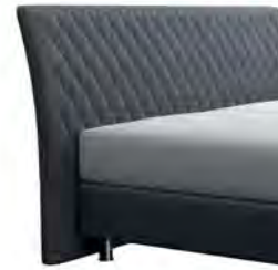
0354 Höhe 116 cm gegen Aufpreis