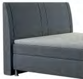
0050 Höhe 117 cm Standard